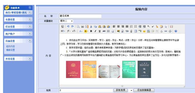
图 1 设置首页

操作流程： 页面设置→修改内容→选择板块→输入板块名称→编辑内容（文字、图片）→单击“提交”