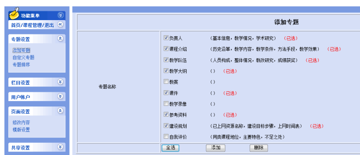
图 2 设置专题（预定义）