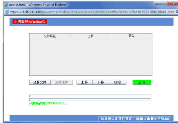
图 5 视频上传窗口

（注意： 视频需要在后台转码，转码需要一定时间，刚上传的视频可能不能播放；课堂录像及字幕等请合成制作完成，形成单个视频文件。建议单个文件小于 1G）